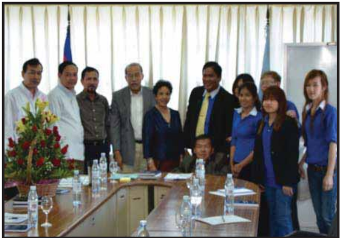
រូបថតអនុស្សាវរីយ៍ រវាងមន្ត្រី គ.ជ.ប និងអង្គការជនពិការកម្ពុជា

ទាក់ទងនឹងការិយាល័យបោះឆ្នោត ឯក ឧត្តមបានបញ្ជាក់បន្ថែមទៀតថា គ.ជ.ប បានណែនាំ ដល់មន្ត្រីលេខាធិការដ្ឋានរាជធានី ខេត្តរៀបចំការ បោះឆ្នោត (លធ/ខប) ឱ្យពិចារណា និងពិនិត្យ មើលថា តើត្រូវជួយសម្រួលដល់ជនពិការនៅពេល បោះឆ្នោតយ៉ាងដូចម្តេច ។ រីឯសម័យវិធីសម្រាប់ឱ្យជន ពិការក្លែងទាំងសងខាងស្ថាប័នក្នុងការបោះឆ្នោត នោះ គឺមាននៅគ្រប់ការិយាល័យបោះឆ្នោតទាំងអស់នៅ ថ្ងៃបោះឆ្នោត ។