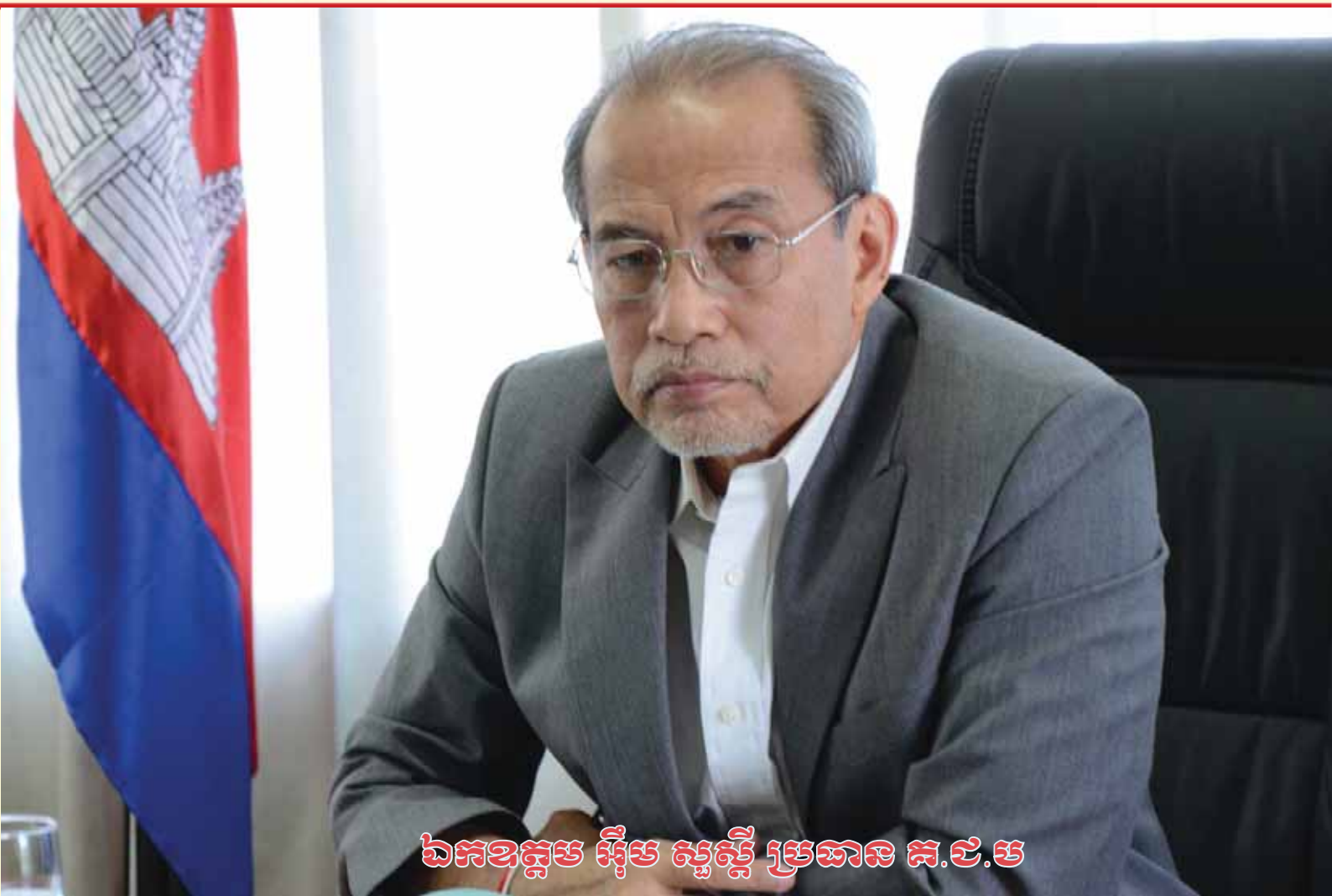
ឯកឧត្តម អ៊ឹម ស៊ីស្ទី ប្រធាន គ.ជ.ប