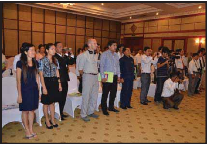
តំណាងអង្គការមិនមែនរដ្ឋាភិបាល ចូលរួមពីជំនុំចុះហត្ថលេខាអនុស្សរណៈយោគយល់គ្នា ជាអង្គការ (IFES) គឺជាអង្គការមិនមែនរដ្ឋាភិបាល ដែលនាំមុខគេក្នុងការផ្តល់ជំនួយបោះឆ្នោត និងការ

ការទទួលខុសត្រូវរបស់ភាគីនៃអនុស្សរណៈការសម្របសម្រួលការងារ ការទំនាក់ទំនង ថែរវេលានៃការអនុវត្ត ការកែប្រែ និងការបញ្ចប់អនុស្សរណៈជាដើម។ តាមខ្លឹមសារនៃអនុស្សរណៈនេះបានលើកឡើង