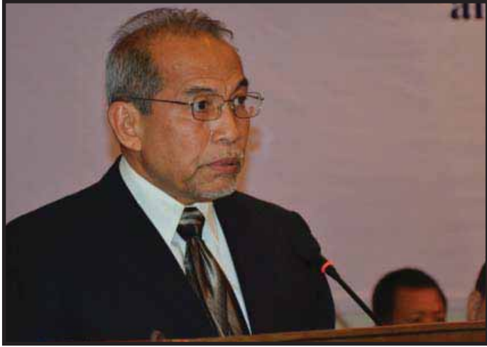
ឯកឧត្តម ស៊ីម ស៊ីថី ប្រធាន គ.ជ.ប មានប្រសាសន៍ក្នុងពិធីសម្ពោធដាក់ឱ្យប្រើប្រាស់សេវាព័ត៌មានស្តីពីការបោះឆ្នោត

ចង់ស្តាប់ ដោយគ្រាន់តែចុចលេខ ១២៨៥ លើទូរស័ព្ទ រួចបញ្ជូន ហើយស្តាប់តាមការណែនាំសារជាសំឡេងនោះ ។ សេវាព័ត៌មានស្តីពីការបោះឆ្នោត រួមមាន ព័ត៌មានទាក់ទងនឹងរបៀបនៃការបោះឆ្នោត ពេលវេលាដែលការិយាល័យបោះឆ្នោតនឹងត្រូវបើក ឯកសារដែលត្រូវការសម្រាប់ការបោះឆ្នោត ឬធ្វើយ៉ាងដូចម្តេចដើម្បីឱ្យដឹងថា តើប្រជាពលរដ្ឋបានចុះឈ្មោះបោះឆ្នោតហើយឬនៅ និងថា តើត្រូវទៅបោះឆ្នោតនៅកន្លែងណា ?