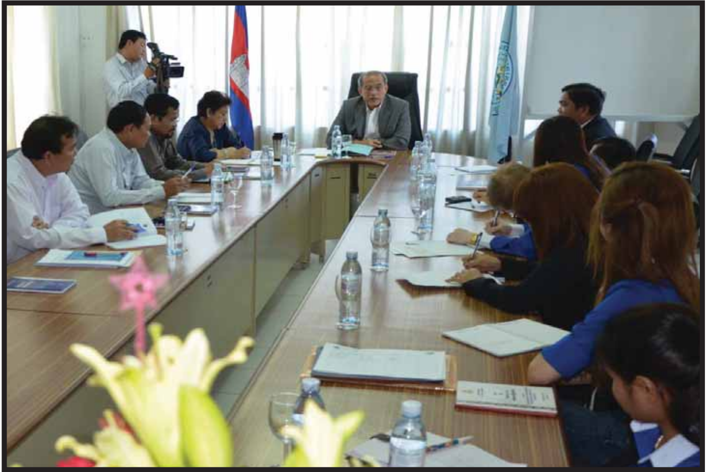
ជំនួបពិភាក្សារវាង គ.ជ.ប ជាមួយអង្គការជនពិការកម្ពុជា