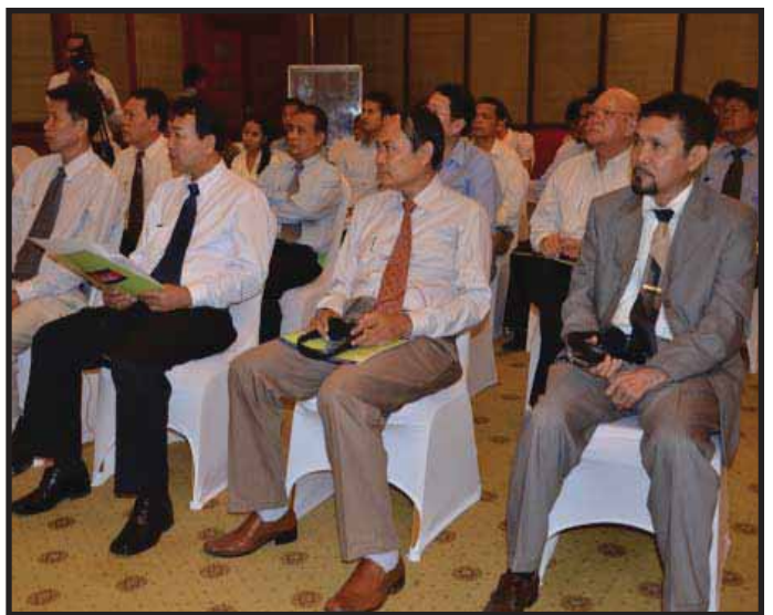
ឯកឧត្តមអគ្គលេខាធិការ អគ្គលេខាធិការរង គ.ជ.ប អញ្ជើញចូលរួមពីសម្ពោធដាក់ឱ្យប្រើប្រាស់សេវាព័ត៌មានស្តីពីការបោះឆ្នោត ឆ្នាំ២០១៣

តាមរយៈសេវាព័ត៌មាននេះ ប្រជាពលរដ្ឋកម្ពុជាទាំងអស់ នឹងអាចស្តាប់ព័ត៌មានជាមូលដ្ឋានអំពីការបោះឆ្នោតជ្រើសតាំងតំណាងរាស្ត្រ នីតិកាលទី៥ ឆ្នាំ២០១៣ ដោយគ្រាន់តែធ្វើការហៅទូរស័ព្ទធម្មតាទៅកាន់លេខពិសេស ១២៨៥ ដោយ ឥតគិតថ្លៃ ។