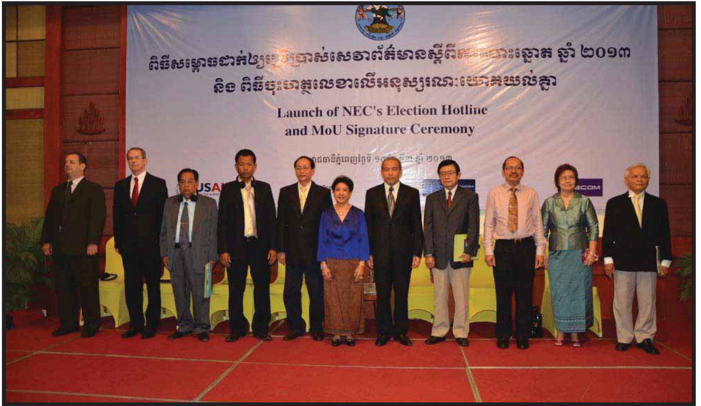
រូបថតអនុស្សរវីរីយ៍ការចុះហត្ថលេខាលើអនុស្សរណៈយោគយល់គ្នា រវាង គ.ជ.ប មូលនិធិអន្តរជាតិសម្រាប់ប្រព័ន្ធបោះឆ្នោត និងវិទ្យាស្ថានប៊េកឡាយ

ការទទួលខុសត្រូវរបស់ភាគីនៃអនុស្សរណៈការសម្របសម្រួលការងារ ការទំនាក់ទំនង ថែរវេលានៃការអនុវត្ត ការកែប្រែ និងការបញ្ចប់អនុស្សរណៈជាដើម។ តាមខ្លឹមសារនៃអនុស្សរណៈនេះបានលើកឡើង