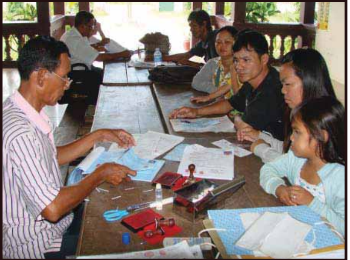
ការធ្វើលិខិតបញ្ជាក់អត្តសញ្ញាណសម្រាប់បម្រើឱ្យការបោះឆ្នោត

២- ទាក់ទងនឹងលិខិតបញ្ជាក់អត្តសញ្ញាណដើម្បីប្រើប្រាស់ក្នុងការបោះឆ្នោត ប្រជាពលរដ្ឋដែលគ្មានឯកសារបញ្ជាក់អត្តសញ្ញាណ ដើម្បីបោះឆ្នោត