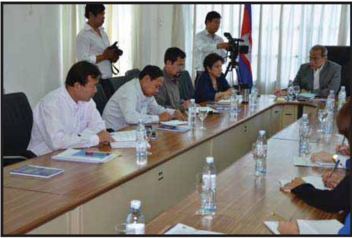
មន្ត្រី គ.ជ.ប ជំនួបពិភាក្សាជាមួយអង្គការជនពិការកម្ពុជា

មិនអាចកែប្រែបានទេ ។ ប៉ុន្តែយើងអាចធ្វើកិច្ចការ នេះនៅពេលពិនិត្យបញ្ជីឈ្មោះ និងចុះឈ្មោះ បោះឆ្នោតឆ្នាំ២០១៣ ។ ក៏ប៉ុន្តែឯកឧត្តម បានសុំឱ្យ អង្គការជនពិការពិភាក្សាជាមួយជនពិការ ថា តើ ពួកគាត់ចង់បង្ហាញឈ្មោះ ឬយ៉ាងណានៅលើបញ្ជី បោះឆ្នោតនោះ ហើយខាង គ.ជ.ប នឹងពិភាក្សាផ្នែក បច្ចេកទេសបន្ថែមទៀត ថា តើត្រូវដាក់កូឡោន បន្ថែមត្រង់ណា ?