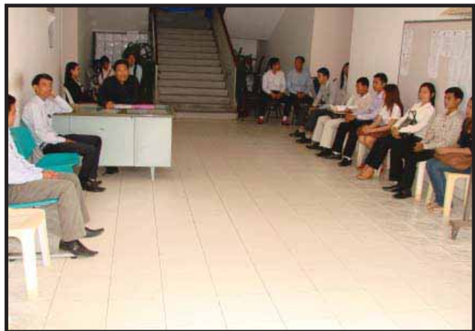
បេក្ខជនដែលមកសម្ភាសន៍ចូលបម្រើការងារនៅទីស្តីការ គ.ជ.ប

គ.ជ.ប បើកទូលាយ មិនរើសអើងសម្រាប់ ប្រជាពលរដ្ឋខ្មែរទាំងពីរភេទស្របតាមមាត្រា ៣៦ នៃរដ្ឋធម្មនុញ្ញដែលចែងថា "ប្រជាពលរដ្ឋខ្មែរទាំង ពីរភេទ មានសិទ្ធិជ្រើសរើសមុខរបរ សមស្របតាម សមត្ថភាពរបស់ខ្លួន តាមសេចក្តីត្រូវការរបស់សង្គម" ។ ម្យ៉ាងទៀត តាមច្បាប់បោះឆ្នោតជ្រើសតំណែង រាស្ត្រមាត្រា១២ ចែងថា" គ.ជ.បជា អង្គការឯករាជ្យ និងអព្យាក្រឹត ក្នុងការអនុវត្តសមត្ថកិច្ចរបស់ខ្លួន ។ សមាជិកទាំងឡាយនៃ គ.ជ.ប និងសមាជិក នៃគណៈ កម្មការរៀបចំការបោះឆ្នោតគ្រប់លំដាប់ថ្នាក់ ត្រូវ មានជំហរអព្យាក្រឹតឥតលម្អៀង ក្នុងការអនុវត្ត ការងារបោះឆ្នោត" ។