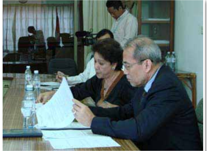
ជំនួបរវាង គ.ជ.ប និងសហភាពអឺរ៉ុប កាលពីថ្ងៃទី១១ ខែមេសា ឆ្នាំ២០១២ កន្លងទៅ

កាលពីថ្ងៃទី១១ ខែមេសា ឆ្នាំ២០១២ វេលាម៉ោង ០៩:០០នាទីព្រឹក ឯកឧត្តម អ៊ឹម សួស្តី ប្រធានគណៈកម្មាធិការជាតិរៀបចំការបោះឆ្នោត(គ.ជ.ប) បានអនុញ្ញាតឱ្យគណៈប្រតិភូសហភាពអឺរ៉ុបចំនួន ៥រូប ដែលដឹកនាំដោយឯកឧត្តម ហ្សង់ ហ្វ្រង់ស័រ កូតាំង (Jean-François CAUTAIN) ឯកអគ្គរដ្ឋទូត និងជាប្រធានប្រតិភូនៃសហភាពអឺរ៉ុបប្រចាំព្រះរាជាណាចក្រកម្ពុជា ចូលរួមពិភាក្សានិងស្វែងយល់អំពីការបោះឆ្នោត ជាពិសេសគឺការបោះឆ្នោតជ្រើសរើសក្រុមប្រឹក្សាឃុំ សង្កាត់ អាណត្តិទី៣ ។