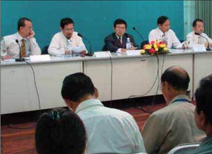
សន្និសីទសារព័ត៌មានកាលពីថ្ងៃទី១៨ ខែមេសា ឆ្នាំ២០១២

តាមតារាងលទ្ធផលផ្លូវការនៃការចុះបញ្ជីបេក្ខជន នៃគណបក្សនយោបាយឈរឈ្មោះបោះឆ្នោតជ្រើស រើសក្រុមប្រឹក្សាឃុំ សង្កាត់ អាណត្តិទី៣ ឆ្នាំ២០១២ ចេញ ផ្សាយថ្ងៃទី២៣ ខែមេសា ឆ្នាំ២០១២ ( សូមមើលទំព័រខាង ក្រោយ ) បានបង្ហាញថាមានគណបក្សនយោបាយចំនួន ១០ បានចុះបញ្ជីបេក្ខជនឈរឈ្មោះ និងមានបេក្ខជនឈរ ឈ្មោះបោះឆ្នោតសរុបចំនួន ១១១.០៥៦នាក់ ក្នុងនោះស្ត្រី មានចំនួន ២៨.៤៨១នាក់ សម្រាប់ការបោះឆ្នោតនេះ ។