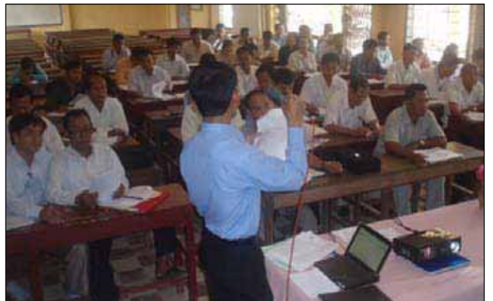
វគ្គបណ្តុះបណ្តាលនៅ គខប ស្វាយរៀង