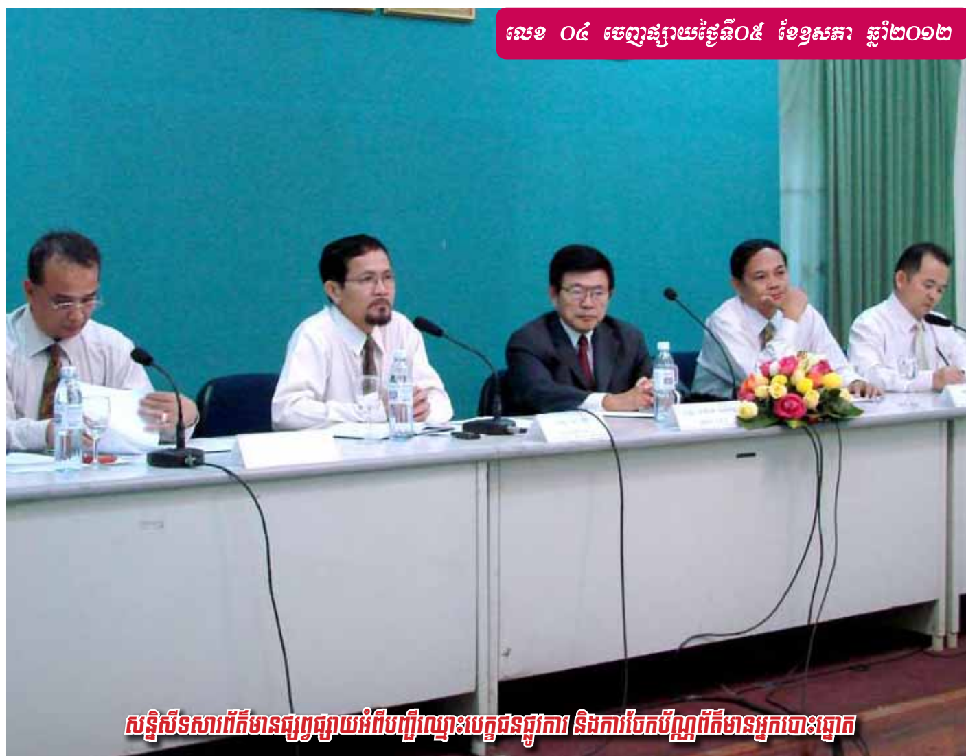
សន្និសីទសារព័ត៌មានជូរជូនអំពីបញ្ជីឈ្មោះបេក្ខជនជូរជូនការ និងការចែកប័ណ្ណព័ត៌មានអ្នកបោះឆ្នោត

លេខ ០៤ ចេញផ្សាយថ្ងៃទី០៥ ខែឧសភា ឆ្នាំ២០១២