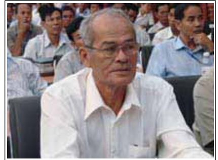
លោក ហ្គុត ជុន ប្រធាន គឧប ព្រះសីហនុ

លេខចូរស័ព្ទទំនាក់ទំនង : ០១២-៨២០-១៨៨ / ០៩៧-៩-៨៩៩-៩៦៣