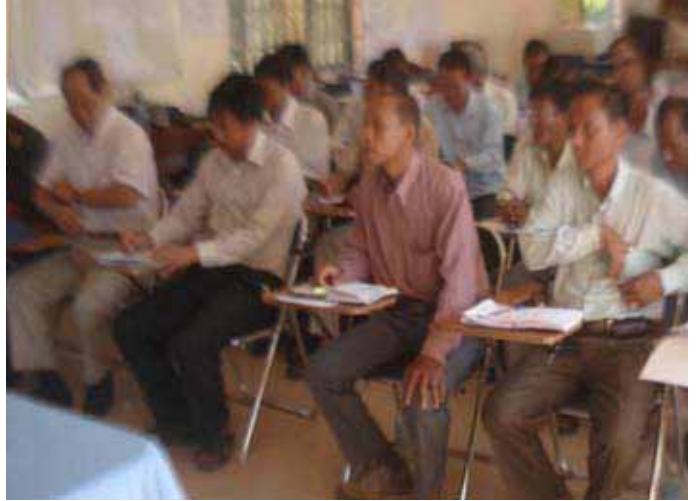
កិច្ចប្រជុំរបស់គណៈកម្មការរៀបចំការបោះឆ្នោតខេត្តកែប កាលពីថ្ងៃទី១១ ខែឧសភា ឆ្នាំ២០១២

ស្របពេលដែលការយោសាណបោះឆ្នោតជ្រើសរើសក្រុមប្រឹក្សាឃុំ សង្កាត់ អាណត្តិទី៣ ចូលមកដល់និងដើម្បីឲ្យការយោសាណបោះឆ្នោតនេះបានប្រព្រឹត្តទៅដោយរលូន ជោគជ័យ និងប្រកបដោយសុខសន្តិភាព កាលពីថ្ងៃទី១១ ខែឧសភា ឆ្នាំ២០១២ គណៈកម្មការរៀបចំការបោះឆ្នោតខេត្តកែប (គខប) បានបើកកិច្ចប្រជុំមួយដើម្បីផ្សព្វផ្សាយអំពីនីតិវិធី និងការប្រព្រឹត្តទៅនៃការយោសាណបោះឆ្នោតជ្រើសរើសក្រុមប្រឹក្សាឃុំ សង្កាត់ អាណត្តិទី៣ ។ សមាសភាពចូលរួមមានមន្ត្រី គខប កែប មន្ត្រីគណៈកម្មការឃុំ សង្កាត់រៀបចំការបោះឆ្នោត (គយ/សប) តំណាងគណបក្សប្រជាជនកម្ពុជា គណបក្សសម រង្ស៊ី និងគណបក្សហ៊្វិនស៊ិនប៉ិច ស្នងការនគរបាលខេត្ត មេបញ្ជាការកងរាជអាវុធហត្ថខេត្ត លោក លោកស្រីតំណាងគណៈបញ្ជាការឯកភាព ខេត្ត ក្រុង ស្រុក ឃុំ សង្កាត់ និងតំណាងអង្គការមិនមែនរដ្ឋាភិបាលសរុបប្រមាណ ៤៣នាក់ ។