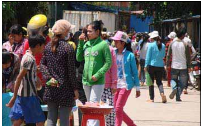
កម្មករ កម្មការិនីបម្រើការងារនៅរោងចក្រ M&V3 នៅសង្កាត់ចាក់អង្រែក្រោម

ជូនដំណឹងនេះដែរពីក្រសួងការងារ និងបណ្តុះបណ្តាល វិជ្ជាជីវៈ កាលពីថ្ងៃទី១០ ខែឧសភា ឆ្នាំ២០១២ ប៉ុន្តែ លោកស្រីពុំទាន់បានជូនដំណឹងនេះទៅនិយោជិត កម្មករ កម្មការិនីនៅឡើយទេ ហើយតាមគម្រោងគឺគ្រោងនឹង ប្រកាសជូនដំណឹងនៅចុងខែឧសភានេះ ។ លោកស្រី បានរំលឹកដែរថា កាលពីពេលពិនិត្យបញ្ជីឈ្មោះ និង ចុះឈ្មោះបោះឆ្នោតឆ្នាំ២០១១ រោងចក្រ M&V3 ក៏បាន ចេញសេចក្តីជូនដំណឹងអនុញ្ញាតឲ្យនិយោជិត កម្មករ កម្មការិនីឈប់សម្រាក ដើម្បីទៅពិនិត្យបញ្ជីឈ្មោះ និង ចុះឈ្មោះបោះឆ្នោតផងដែរ ។