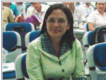
លោកស្រី ប៊ុន សួតី ប្រធាន គឧប ប៉ៃលិន