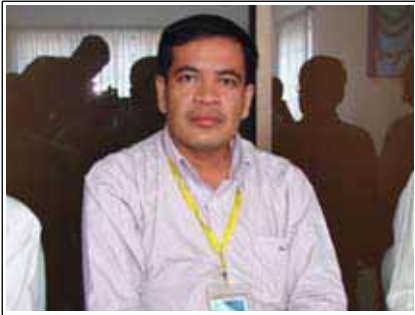
លោក អ៊ែង ឈុនឌី ប្រធាន គឧប រតនគិរី