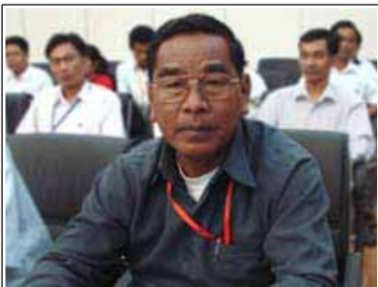
លោក ម៉ុក សែន ប្រធាន គឧប កែប