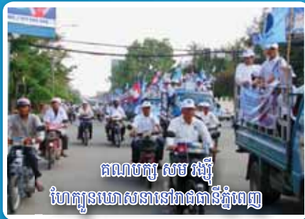
គណបក្ស សម រង្ស៊ី ហែកូនឃោសនានៅរោងចក្រដំឡើង