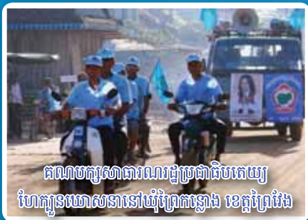
គណបក្សសាធារណរដ្ឋប្រជាជនកម្ពុជា ហែកូនឃោសនានៅឃុំព្រៃកន្លែង ខេត្តព្រៃវែង