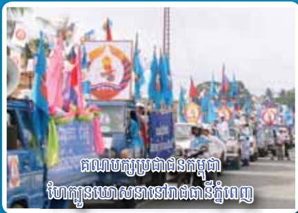
គណបក្សប្រជាជនកម្ពុជា ហែកូនឃោសនានៅរោងចក្រដំឡើង

លេខ ០៧ ចេញផ្សាយថ្ងៃទី៣០ ខែឧសភា ឆ្នាំ២០១២