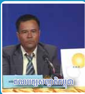
គណបក្សសញ្ញាពិភពម្តៅ