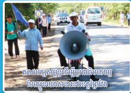
គណបក្សសម្ព័ន្ធដើម្បីប្រជាជនកម្ពុជា ហែកូនឃោសនានៅខេត្តព្រៃវែង