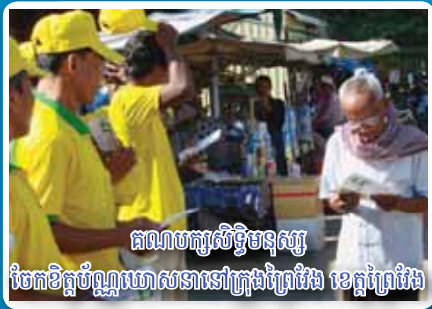
គណបក្សសិទ្ធិមនុស្ស ចែកខិត្តប័ណ្ណឃោសនានៅក្រុងព្រៃវែង ខេត្តព្រៃវែង