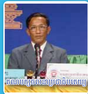
គណបក្សចលនាប្រជាជនកម្ពុជា