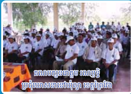
គណបក្សនរោត្តម រណឫទ្ធិ ប្រជុំឃោសនានៅឃុំល្វា ខេត្តព្រៃវែង