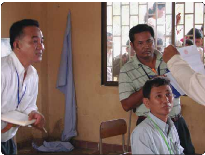
ភ្នាក់ងារនៃគណបក្សនយោបាយចូលរួមសង្កេតមើលដំណើរការបោះឆ្នោតនាពេលកន្លងមក

សម្រាប់ការបោះឆ្នោតជ្រើសរើសក្រុមប្រឹក្សាឃុំ សង្កាត់ អាណត្តិទី៣ ឆ្នាំ២០១២ ភ្នាក់ងារនៃគណបក្សនយោបាយសរុបចំនួន ១១៨.៨១០នាក់ នឹងចូលរួមសង្កេតមើលការបោះឆ្នោតនៅតាមការិយាល័យបោះឆ្នោត ១៨.១០៧ ការិយាល័យទូទាំងប្រទេស ។