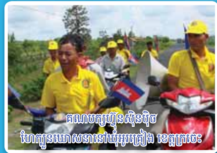
គណបក្សហ៊ុនស៊ីនប៊ុច ហែកូនឃោសនានៅឃុំអូរត្រៀង ខេត្តក្រចេះ