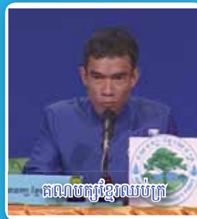
គណបក្សខ្មែរឈប់ក្រ