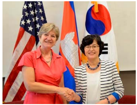
កិច្ចព្រមព្រៀងនេះនឹងអនុញ្ញាតអោយអ្នកស្ម័គ្រចិត្តរបស់ទីភ្នាក់ងារ KOICA ចុះទៅធ្វើការនៅតាមទីតាំងអប់រំដែលជួយដោយទីភ្នាក់ងារ USAID នៅខេត្តសៀមរាប ក្រចេះ និងកំពង់ចាម។

កិច្ចព្រមព្រៀងនេះនឹងអនុញ្ញាតអោយអ្នកស្ម័គ្រចិត្តរបស់ទីភ្នាក់ងារ KOICA ចុះទៅធ្វើការនៅតាមទីតាំងអប់រំដែលជួយដោយទីភ្នាក់ងារ USAID នៅខេត្តសៀមរាប ក្រចេះ និងកំពង់ចាម។ អ្នកស្ម័គ្រចិត្តរបស់ទីភ្នាក់ងារ KOICA ដែលមានបទពិសោធន៍ផ្នែក ICT នឹងបង្រៀនជំនាញកុំព្យូទ័រដល់សិស្សសាលានៅក្នុងបន្ទប់កុំព្យូទ័រដែលជួយដោយទីភ្នាក់ងារ USAID ។