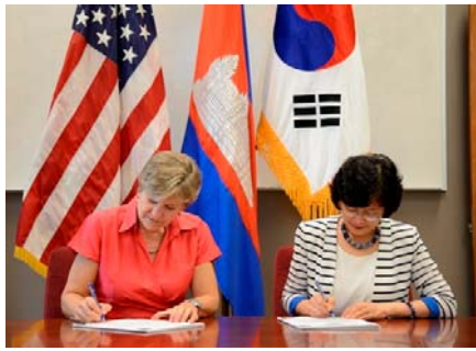
USAID និង KOICA បានចុះហត្ថលេខាលើអនុស្សរណៈនៃការយោគយល់គ្នា ដើម្បីផ្តល់ការបណ្តុះបណ្តាលផ្នែកព័ត៌មាននិងបច្ចេកទេសសារគមនាគមន៍ ដល់សិស្សសាលានៅកម្ពុជា។

នៅថ្ងៃទី ១២ ខែសីហា ទីភ្នាក់ងារសហរដ្ឋអាមេរិកសំរាប់ការអភិវឌ្ឍន៍អន្តរជាតិ (USAID) និងទីភ្នាក់ងារសហប្រតិបត្តិការអន្តរជាតិរបស់កូរ៉េ (KOICA) បានចុះហត្ថលេខាលើអនុស្សរណៈនៃការយោគយល់គ្នានៅស្ថានទូតអាមេរិក ដើម្បីផ្តល់ការបណ្តុះបណ្តាលផ្នែកព័ត៌មាននិងបច្ចេកទេសសារគមនាគមន៍ (Information and Communication Technology ឬ ICT) ដល់សិស្សសាលានៅកម្ពុជា ក្នុងន័យគាំទ្រផែនការយុទ្ធសាស្ត្រក្នុងវិស័យអប់រំរបស់ព្រះរាជាណាចក្រកម្ពុជា។