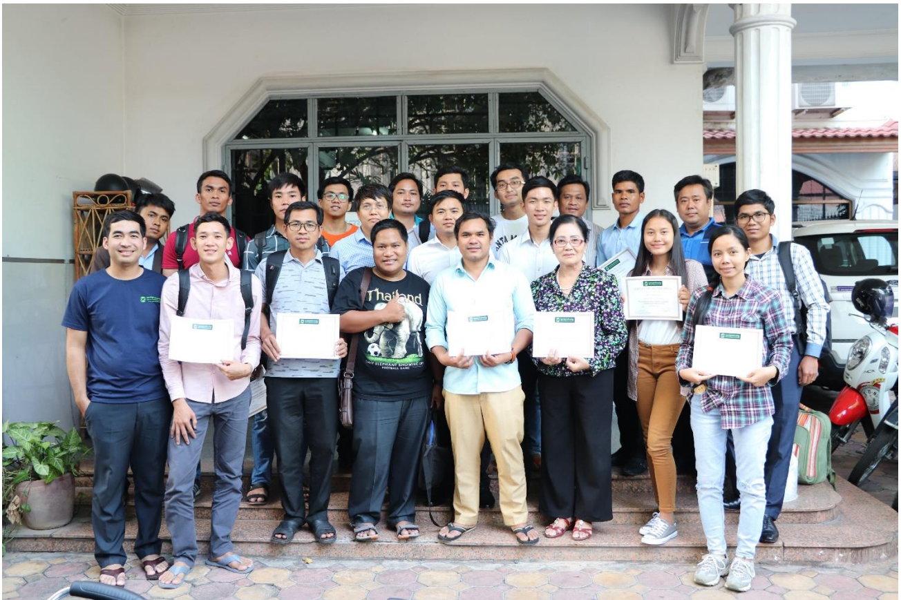
សិក្ខាកាមបានថតរូបដុំគ្នា បន្ទាប់ពីទទួលបានវិញ្ញាបនបត្របញ្ចប់វគ្គសិក្សា។

២. ក្រុមការងារជីវនាយករបស់អង្គការរូឌីស៊ី មានជំនាញផ្នែកជីវនាយក និងមានបទពិសោធន៍ផ្ទាល់ជាមួយការគ្រប់គ្រង និងវិភាគទិន្នន័យផែនទី ដោយការប្រើប្រាស់កម្មវិធីបើកទូលាយ។