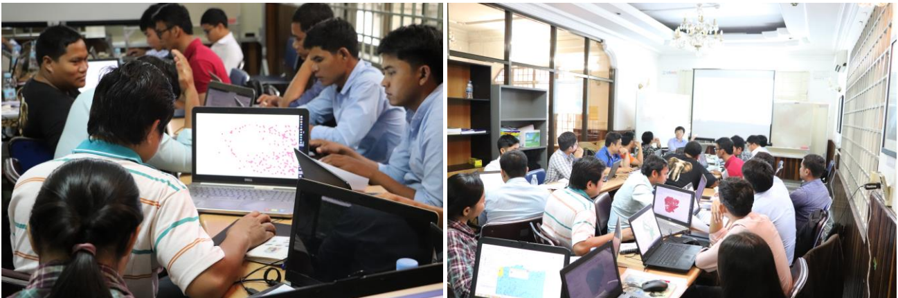
សកម្មភាពនៅក្នុងសិក្ខាសាលាមូលដ្ឋានគ្រឹះនៃ QGIS

សិក្ខាសាលាលើកទី១៖ មូលដ្ឋានគ្រឹះនៃ QGIS (ថ្ងៃទី១២ ដល់ ១៤ ខែមីនា ឆ្នាំ២០១៨)