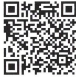
សៀវភៅអាស៊ាន