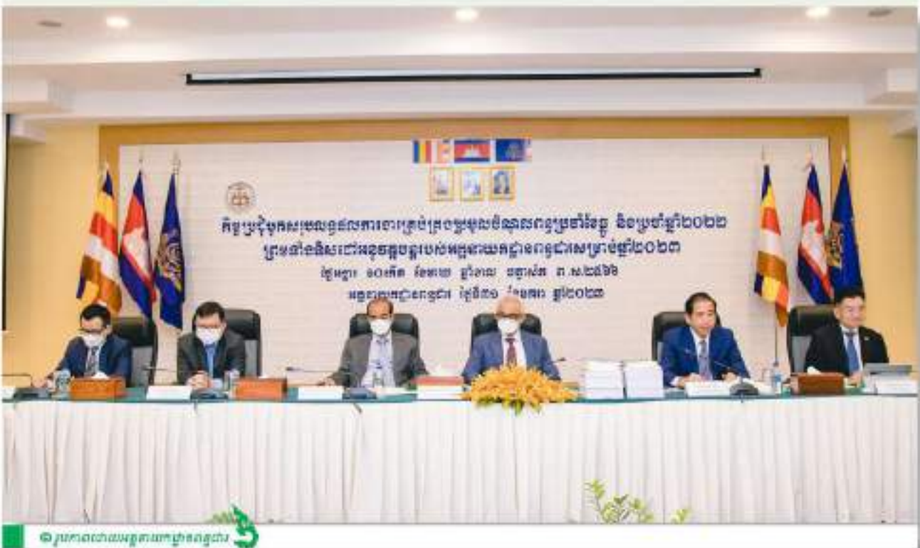
៖ ប្រកាសជាយល់ព្រមនាយកដ្ឋានពន្ធដារ

ថ្ងៃអង្គារ ១០កើត ខែមាឃ ឆ្នាំខាល ចត្វាស័ក ព.ស. ២៥៦៦ អគ្គនាយកដ្ឋានពន្ធដារ ថ្ងៃទី៣១ ខែមករា ឆ្នាំ២០២៣