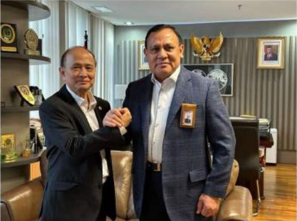
ឯកឧត្តម កិត្តិនីតិកោសលបណ្ឌិត ទេសរដ្ឋមន្ត្រី ឱម យ៉ិនឡឿង ប្រធាន អ.ប.ព. (ឆ្វេង) និង ឯកឧត្តម FIRLI BAHURI ប្រធាន KPK Indonesia (ស្តាំ)

ទស្សនកិច្ចរបស់ ឯកឧត្តម កិត្តិនីតិកោសលបណ្ឌិត ទេសរដ្ឋមន្ត្រី ឱម យ៉ិនឡឿង ប្រធានអង្គភាពប្រឆាំងអំពើពុករលួយ (អ.ប.ព.) ចាប់ពីថ្ងៃទី៨ ដល់ថ្ងៃទី៩ ខែមីនា ឆ្នាំ២០២៣ នៅគណៈកម្មការលុបបំបាត់អំពើពុករលួយឥណ្ឌូនេស៊ី (PKP Indonesia) នាទីក្រុងហ្សាកាតានៃសាធារណរដ្ឋឥណ្ឌូនេស៊ី បានផ្តល់នូវលទ្ធផលដ៏មានសារៈសំខាន់ដ៏ជូនខាងក្រោម៖