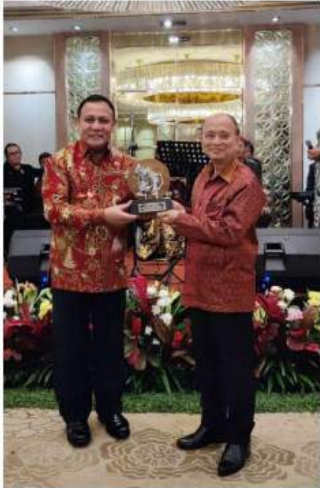
ឯកឧត្តម FIRU BAHURI ផ្តល់ប្តូរវត្ថុអនុស្សាវរីយ៍ជាមួយ ឯកឧត្តម កិត្តិនីតិកោសលបណ្ឌិត ទេសរដ្ឋមន្ត្រី ឌឹម ហ៊ុនឡែង