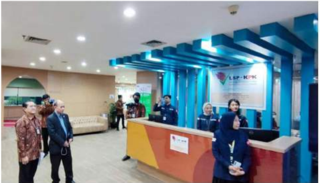
គណៈប្រតិភូ អ.ប.ព. ទស្សនាមជ្ឈមណ្ឌលបណ្តុះបណ្តាលរបស់ KPK