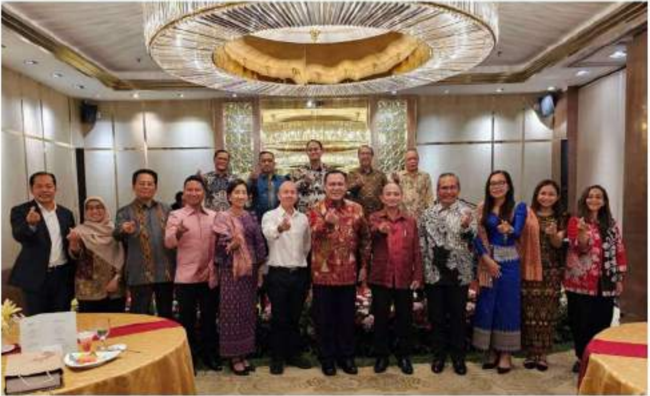
រូបថតអនុស្សាវរីនៅកម្មវិធីជប់លៀងអាហារពេលល្ងាច