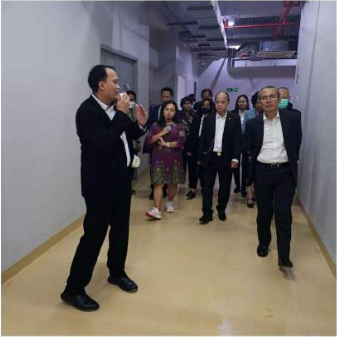
គណៈប្រតិភូ អ.ប.ព. ទស្សនាមជ្ឈមណ្ឌលគ្រប់គ្រងកសិកម្មរបស់ KPK