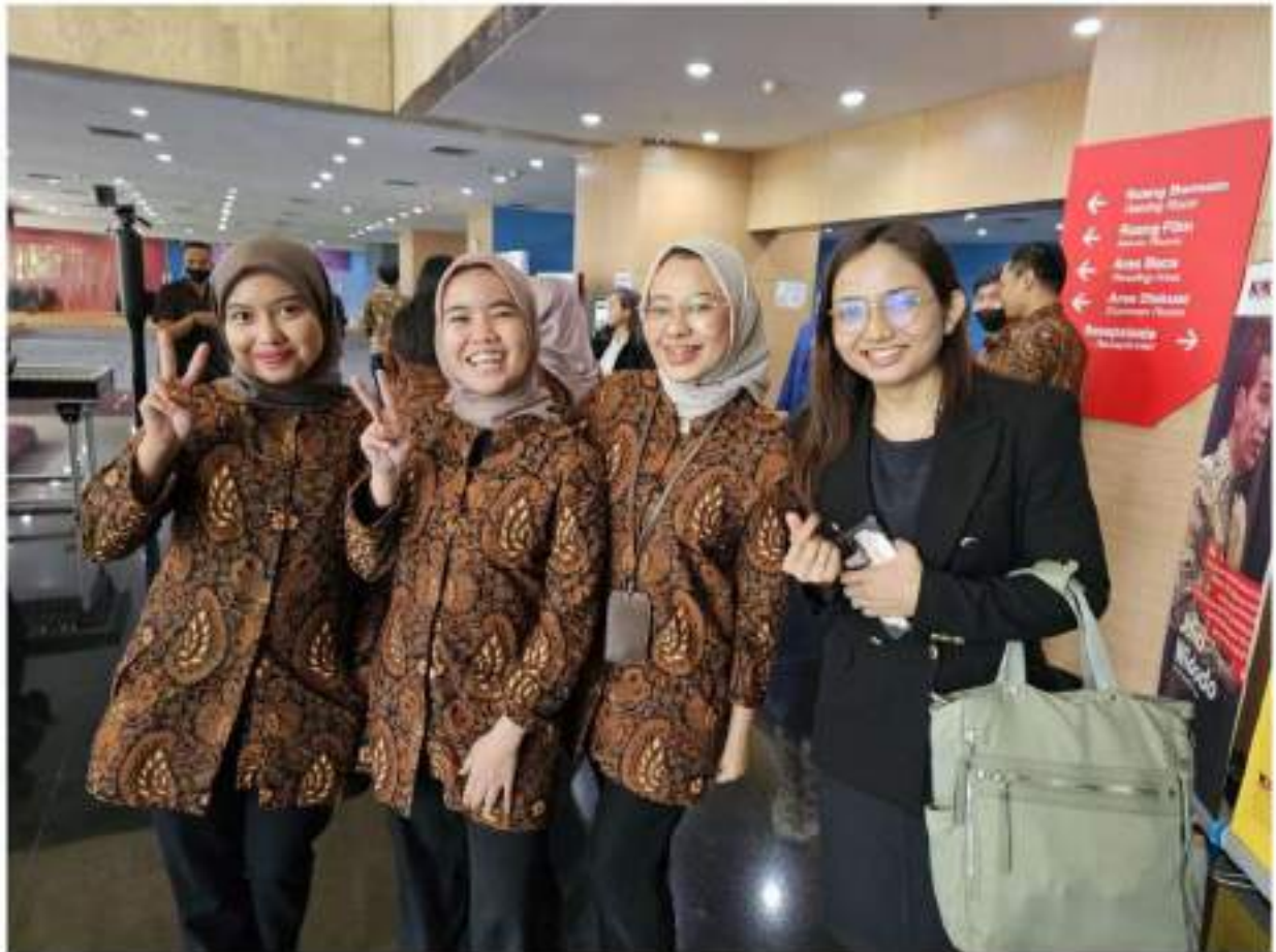
រូបថតអនុស្សាវរីយ៍ជាមួយបុគ្គលិកនៅមជ្ឈមណ្ឌលបណ្តុះបណ្តាលរបស់ KPK