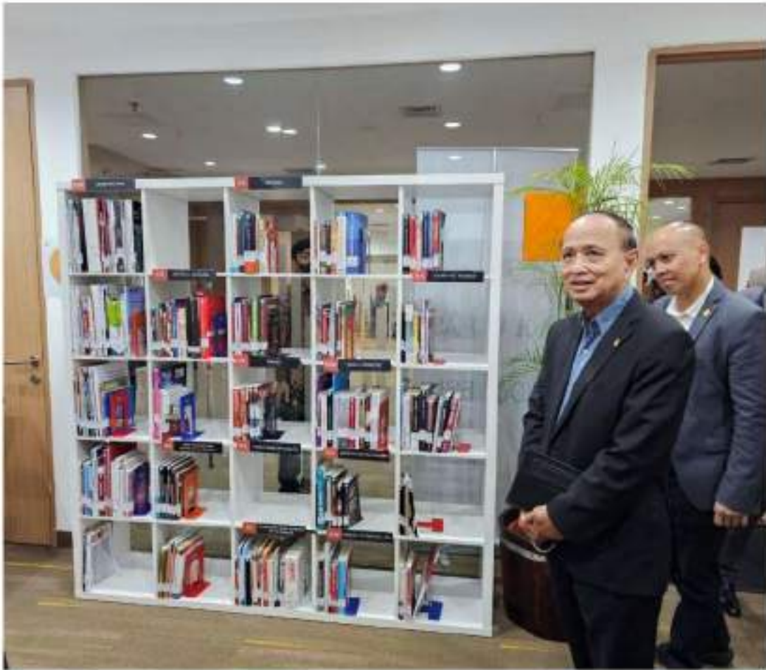
គណៈប្រតិភូ អ.ប.ព. ទស្សនាបណ្ណាល័យ