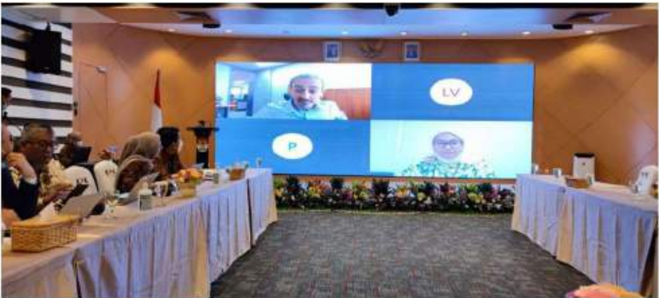
កិច្ចប្រជុំព្រឹត្តិភាគី KPK Indonesia - អ.ប.ព. និងអង្គការ UNODC