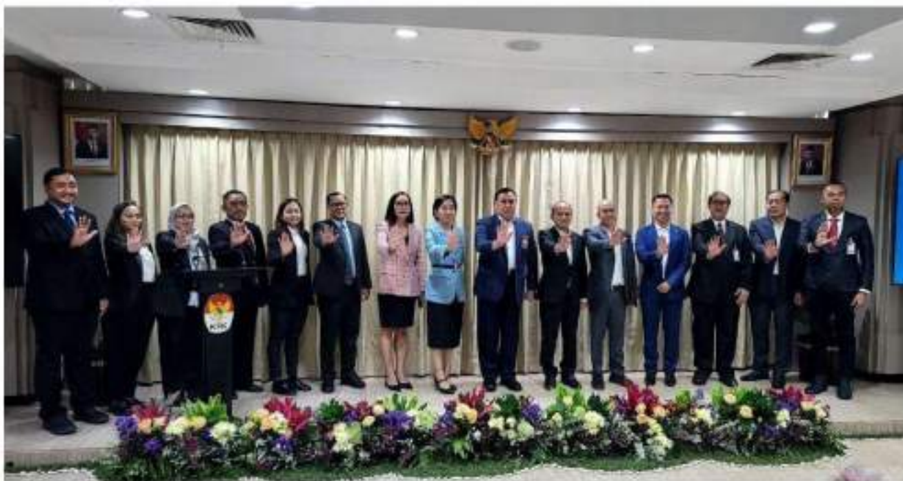
រូបថតអនុស្សាវរីយ៍នៅក្រោយបញ្ចប់ទម្រង់ប្រជុំរបស់ KPK