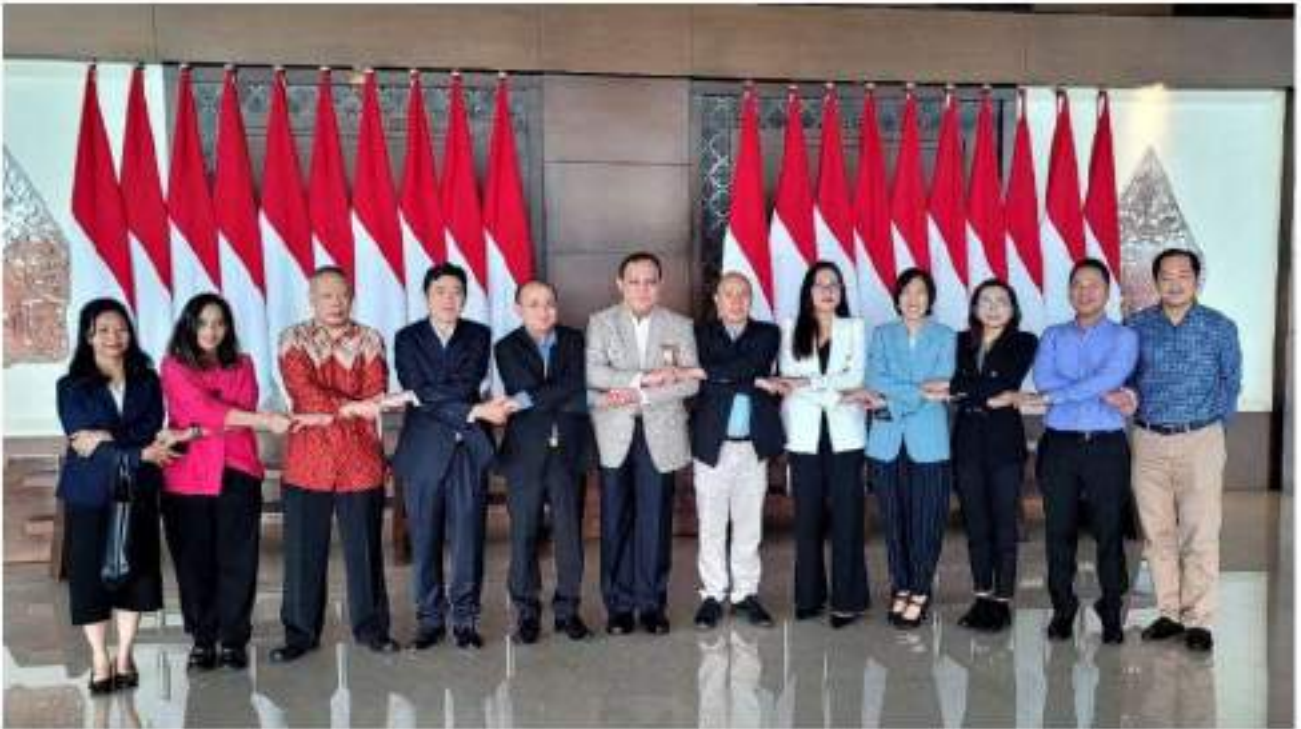
រូបថតអនុស្សាវរី ឯកឧត្តម FIRLI BAHURI និងសហការី - ឯកឧត្តម អ៊ីវ ហ៊ាង ឯកអគ្គរាជទូតកម្ពុជាប្រចាំសាធារណរដ្ឋ ឥណ្ឌូនេស៊ី(ទី៤ ពីឆ្វេង) និងសហការី - ឯកឧត្តម កិត្តិនីតិកោសលបណ្ឌិត ទេសរដ្ឋមន្ត្រី ឌឹម យ៉ុនឡើង និងគណៈប្រតិភូ នៅចំណាតចេញដំណើរពិសេសក្នុងអាកាសយានដ្ឋានអន្តរជាតិសេកាណូ ហាតា នៃទីក្រុងហ្សឺណែវ