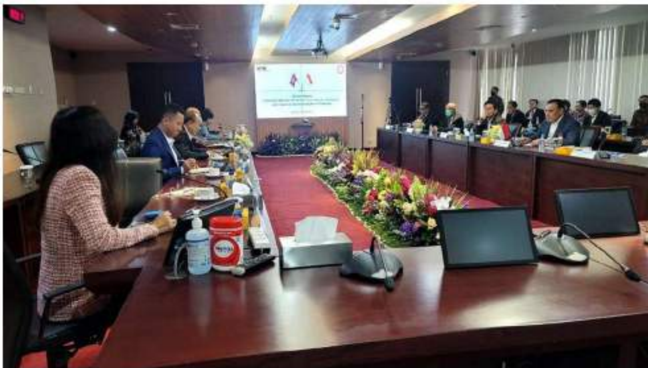
កិច្ចជំនុំប្រឡោតីរវាង KPK Indonesia និង អ.ប.ព. កម្ពុជា