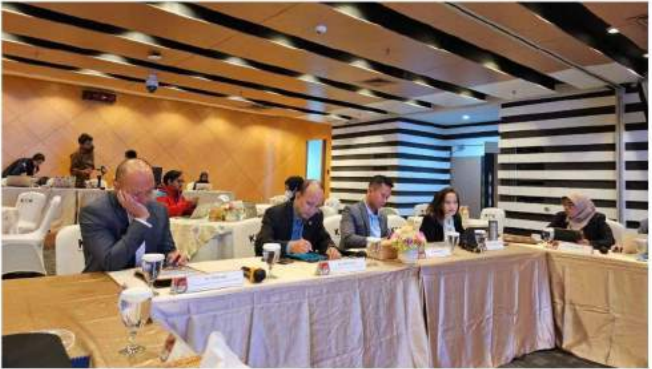
កិច្ចប្រជុំទ្វេភាគី KPK Indonesia - អ.ប.ព.