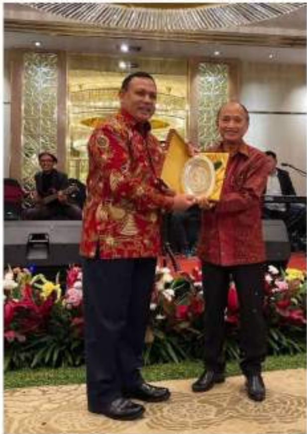
ឯកឧត្តម កិត្តិនីតិកោសលបណ្ឌិត ទេសរដ្ឋមន្ត្រី ឌឹម ហ៊ុនឡែង ផ្តល់ប្តូរវត្ថុអនុស្សាវរីយ៍ជាមួយ ឯកឧត្តម FIRU BAHURI