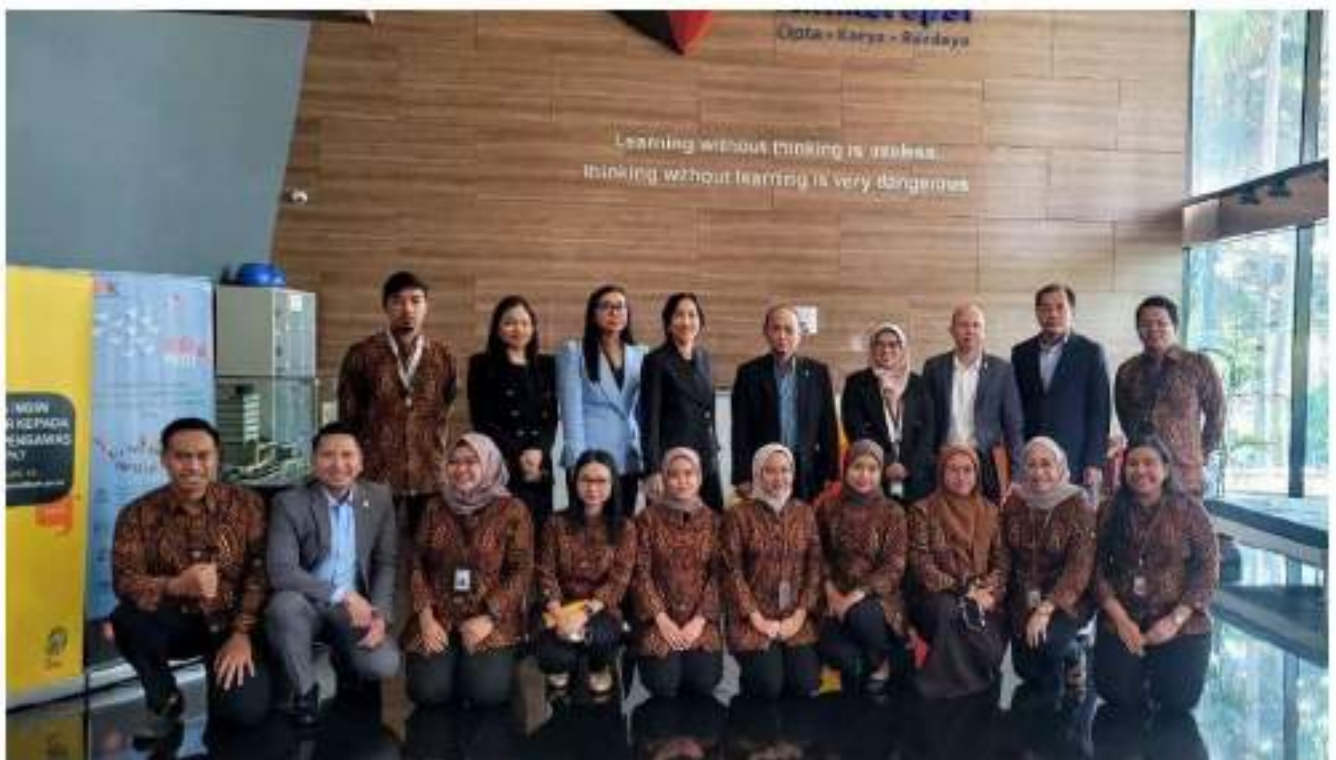
រូបថតអនុស្សាវរីយ៍នៅមជ្ឈមណ្ឌលបណ្តុះបណ្តាលរបស់ KPK