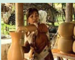
មីងនាគ ជាសិប្បករ