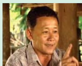
ពូជំនោរ ជាសិប្បករ