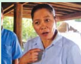
មីងសុភាព ជាស្ត្រីសកម្មក្នុងឃុំ