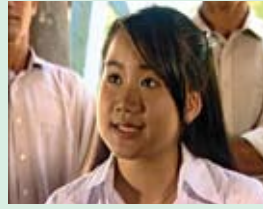
គង្គារ ជាតិស៊ីរត