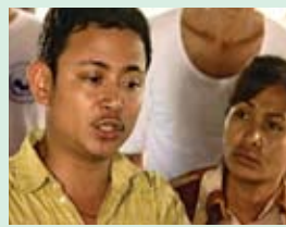
ចំរើន ជាកសិករ