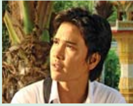
សិលា ជាតិស៊ីរត