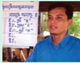
សម្បត្តិ ជាតំណាងអង្គការខុមហ្វ្រែល