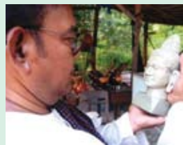
តាសួន ជាច្រីទ្វាចារ្យយល់ដឹងច្រើនក្នុងឃុំ