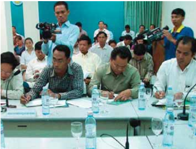
កាលពីថ្ងៃទី២៤ ខែតុលា នៅទីស្តីការ គ.ជ.ប

យោងតាមបទបញ្ជា និងនីតិវិធីរបស់ គ.ជ.ប កាលបរិច្ឆេទនៃការដាក់ពាក្យសុំចុះឈ្មោះអ្នកសង្កេតការណ៍ ជាតិ និងអន្តរជាតិមានដូចខាងក្រោម ៖