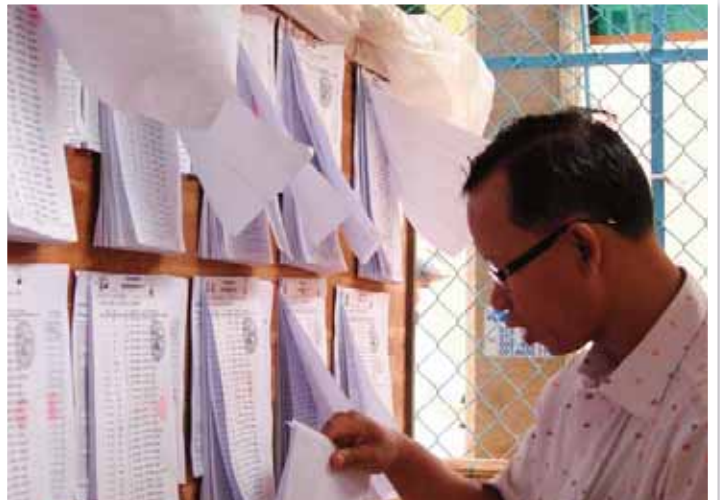
សកម្មភាពប្រជាជនរដ្ឋមកពិនិត្យបញ្ជីបោះឆ្នោតដំបូងនៅសាលាសង្កាត់បឹងទំពុន