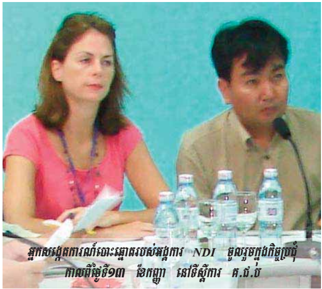
អ្នកសង្កេតការណ៍បោះឆ្នោតរបស់អង្គការ NDI មូលនិធិអន្តរជាតិសម្រាប់ប្រព័ន្ធបោះឆ្នោត (IFES) កាលពីថ្ងៃទី១៣ ខែកញ្ញា នៅទីស្តីការ គ.ជ.ប

១០- វិទ្យាស្ថានជាតិប្រជាធិបតេយ្យ(NDI) មានអ្នកសង្កេតការណ៍សរុប១៤៤នាក់ ស្រី៨នាក់។