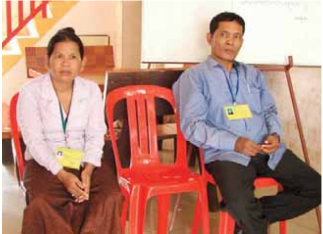
ភ្នាក់ងារសង្កេតការណ៍បោះឆ្នោតរបស់គណបក្សសមរង្ស៊ី

ឆ្នាំ២០១២ និងការបោះឆ្នោតជ្រើសរើសក្រុមប្រឹក្សាឃុំសង្កាត់ អាណត្តិទី៣ ឆ្នាំ២០១២ ដោយមិនតម្រូវឱ្យស្នើសុំម្តងទៀតឡើយ។