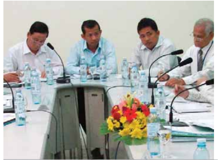
តំណាងគណបក្សនយោបាយមូលនិធិអន្តរជាតិសម្រាប់ប្រព័ន្ធបោះឆ្នោត

ដោយឡែក មានគណបក្សនយោបាយចំនួន៦ បានដាក់តំណាងរបស់ខ្លួនសរុប១០.០៩១នាក់ ស្រ្តី ៧៤២នាក់ ក្នុងនោះពេញសិទ្ធិចំនួន៥.២៤៨នាក់ ស្រ្តី ៣៣២នាក់ និងបម្រុងចំនួន៤.៨៤៣នាក់ ស្រ្តី៤១០នាក់ ចូលរួមសង្កេតការណ៍ក្នុងដំណើរការពិនិត្យបញ្ជីឈ្មោះ និងចុះឈ្មោះបោះឆ្នោតឆ្នាំ២០១១ រួមមាន ៖