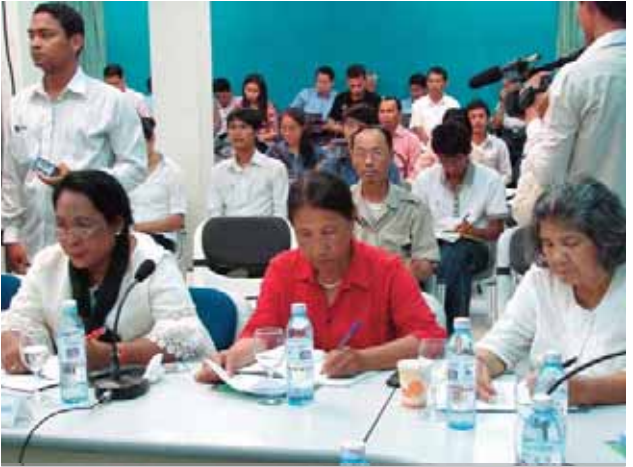
កិច្ចប្រជុំកាលពីថ្ងៃទី២៤ ខែតុលា នៅទីស្តីការ គ.ជ.ប

អង្គការមិនមែនរដ្ឋាភិបាលជាតិ និងអន្តរជាតិដែល គ.ជ.ប ទទួលស្គាល់រួមមាន ៖