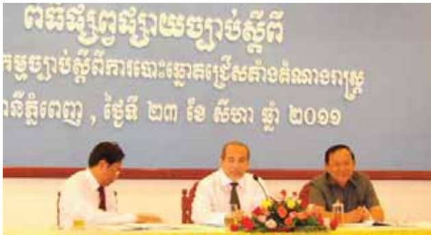
ឯកឧត្តម អ៊ឹម សួស្តី ប្រធាន គ.ជ.ប ( រូបកណ្តាល )

កាលពីថ្ងៃទី២៣ ខែសីហា ឆ្នាំ២០១១ ឯកឧត្តម អ៊ឹម សួស្តី ប្រធាន គ.ជ.ប បានធ្វើជាអធិបតីភាពក្នុង ពិធីផ្សព្វផ្សាយច្បាប់បោះឆ្នោតជ្រើសតាំងតំណាងរាស្ត្រ និងច្បាប់ស្តីពីវិសោធនកម្មនៃច្បាប់នេះ នៅសាលារាជធានី ភ្នំពេញដល់សាធិកក្រុមប្រឹក្សាខណ្ឌ និងក្រុមប្រឹក្សា សង្កាត់ នៅទូទាំងរាជធានីភ្នំពេញ។