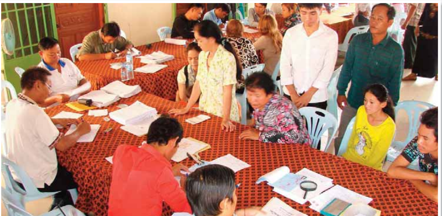
សកម្មភាពប្រជាជនរដ្ឋមកសុំលិខិតបញ្ជាក់អត្តសញ្ញាណសម្រាប់ប្រើឱ្យការបោះឆ្នោតនៅសាលាសង្កាត់ស្ទឹងមានជ័យ កាលពីថ្ងៃកញ្ញាកន្លងទៅ