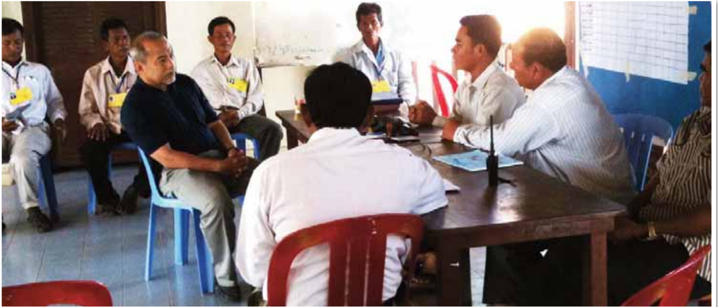
ឯកឧត្តម ឌីម ស៊ុនី ប្រធាន គ.ជ.ប ( រូបឆ្នាំខ្មៅ ) ចុះណែនាំការងារពិនិត្យបញ្ជីឈ្មោះ និងចុះឈ្មោះបោះឆ្នោត ដល់ច្បង្គីចុះឈ្មោះបោះឆ្នោត នៅសង្កាត់សំរោង