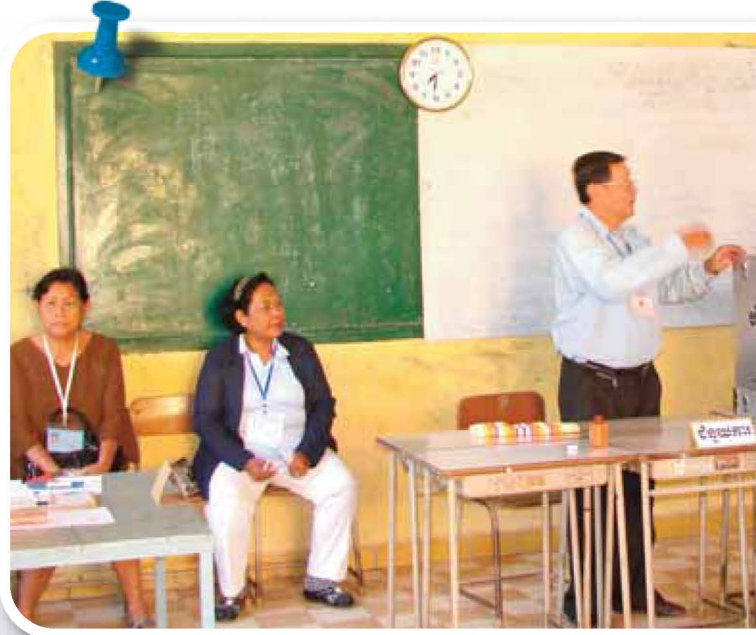
អ្នកសង្កេតការណ៍សង្កេតមើលការបោះឆ្នោត