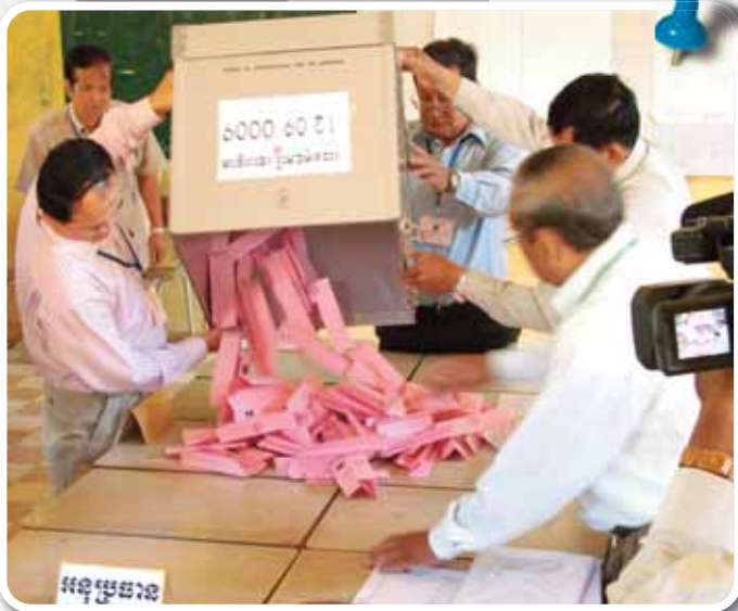
សកម្មភាពបើកបរិបឆ្នោត និងចាក់សន្លឹកឆ្នោត