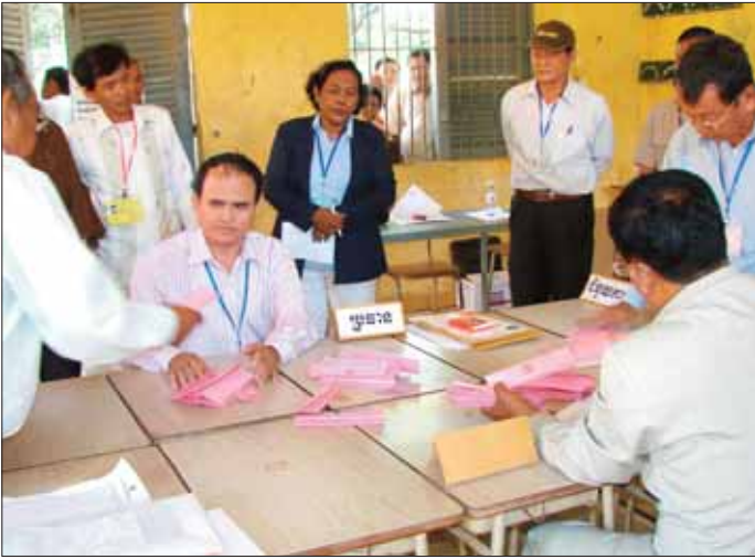
សកម្មភាពរៀបចំសន្លឹកឆ្នោតជាពុំទុកនៅការិយាល័យរាប់សន្លឹកឆ្នោតក្នុងមក

ពិនិត្យឡើងវិញក្រោយពីការបញ្ចប់ការរាប់សន្លឹកឆ្នោតនៅខាងពុំទុកទី១។ ចំពោះការងារបន្តមកទៀតក្រោយពីការរាប់សន្លឹកឆ្នោត គឺការប្រកាសលទ្ធផល និងការបិទផ្សាយលទ្ធផលនៃការរាប់សន្លឹកឆ្នោតនៅការិយាល័យរាប់សន្លឹកឆ្នោត។ ប្រធានត្រូវណែនាំអំពីការធ្វើកំណត់ហេតុនៃការរាប់សន្លឹកឆ្នោត បន្ទាប់មកគាត់ប្រកាសលទ្ធផលនៃការរាប់សន្លឹកឆ្នោតនៅទីនោះ ដោយណែនាំឱ្យលេខាធិការយកកំណត់ហេតុនៃការរាប់សន្លឹកឆ្នោតនេះ យកមកដើម្បីចុះហត្ថលេខា និងបោះត្រា គាត់អាចអញ្ជើញតំណាងគណបក្សនយោបាយចូលរួមចុះហត្ថលេខាលើកំណត់ហេតុនេះបើសិនជាយល់ព្រម ហើយបន្ទាប់មកត្រូវយកកំណត់ហេតុនៃការរាប់សន្លឹកឆ្នោតនេះទៅបិទនៅការិយាល័យរាប់សន្លឹកឆ្នោតនៅល្ងាចនៃថ្ងៃបោះឆ្នោតនោះតែម្តង។ ប្រធានក៏ត្រូវណែនាំឱ្យបំពេញលើទម្រង់តារាងលទ្ធផលនៃការបោះឆ្នោត ដើម្បីចែកជូនឱ្យគណបក្សនយោបាយដែលមានវត្តមាននៅទីនោះដែរ។ នេះជាដំណើរការរួមនៃការបោះឆ្នោត និងរាប់សន្លឹកឆ្នោត។