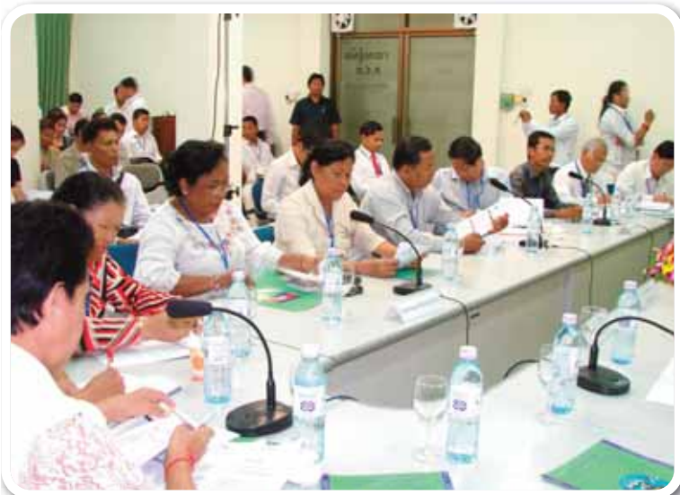
កិច្ចប្រជុំកាលបរិច្ឆេទទី០៦ ខែកញ្ញា ឆ្នាំ២០១១