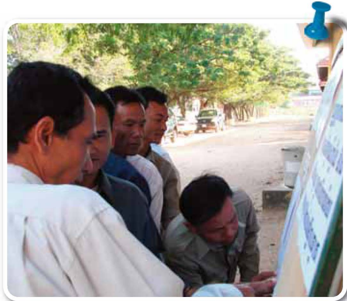
សកម្មភាពពិនិត្យបញ្ជីឈ្មោះមុនចូលបោះឆ្នោត