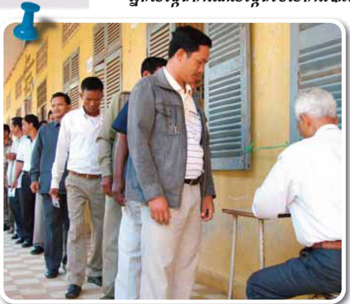
ការតម្រង់ជួរមុខការិយាល័យបោះឆ្នោត