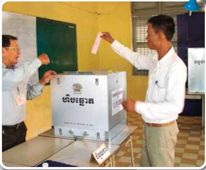
ការបោះឆ្នោត