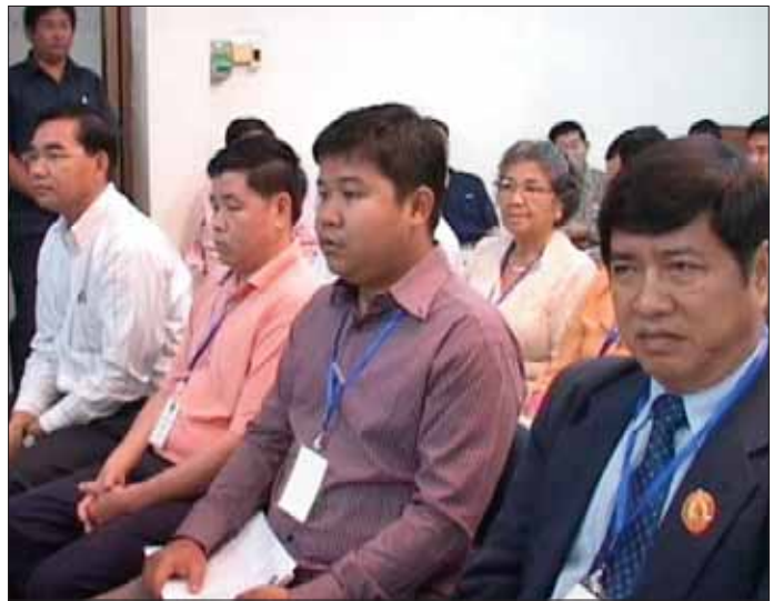
តំណាងគណបក្សនយោបាយសង្កេតមើលការចាប់ឆ្នោត

ដូចគ្នានេះដែរ ការកំណត់លំដាប់លេខរៀង គណបក្សនយោបាយនៅលើសន្លឹកឆ្នោត ក៏ដើម្បីឱ្យអ្នក បោះឆ្នោតបានដឹង និងឈានទៅធ្វើការសម្រេចចិត្តជ្រើស រើសយកគណបក្សណាមួយ ក្នុងចំណោមគណបក្សនយោ បាយដែលបានចូលរួមប្រកួតប្រជែងក្នុងការបោះឆ្នោត។