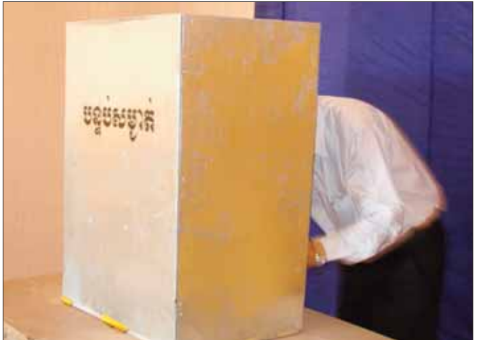
សកម្មភាពចូលក្នុងបន្ទប់សម្ងាត់ដើម្បីគូសសន្លឹកឆ្នោត នាការបោះឆ្នោតក្នុងមក

មន្ត្រីដែលទទួលបន្ទុកសណ្តាប់ធ្នាប់ដែលយាមនៅមាត់ច្រកចូលនៅការិយាល័យបោះឆ្នោត អញ្ជើញអ្នកបោះឆ្នោតជាដំបូងចំនួន៤នាក់ ចូលទៅក្នុងការិយាល័យបោះឆ្នោត ហើយអ្នកបោះឆ្នោតត្រូវអនុវត្តតាមខ្សែសង្វាក់ការងារបោះឆ្នោតនៅក្នុងការិយាល័យបោះឆ្នោត។ ជាបឋម គាត់ត្រូវតែជួបលេខាធិការនៃគណៈកម្មការការិយាល័យបោះឆ្នោត ដោយបង្ហាញឯកសារបញ្ជាក់អត្តសញ្ញាណរបស់គាត់ ហើយលេខាធិការធ្វើការត្រួតពិនិត្យម្រាមដៃគាត់ តើមានប្រឡាក់ទឹកខ្មៅលុបលាងមិនជ្រះទេ ក្នុងករណីមិនទាន់បានបោះឆ្នោតទេ ដែររបស់គាត់គឺស្អាត បន្ទាប់មកត្រូវត្រួតពិនិត្យមើលផ្ទៀងផ្ទាត់ឈ្មោះគាត់ និងឯកសារបញ្ជាក់អត្តសញ្ញាណរបស់គាត់ទៅនឹងបញ្ជីបោះឆ្នោតក្នុងករណីត្រឹមត្រូវហើយ លេខាធិការឯកសារបញ្ជាក់អត្តសញ្ញាណទៅតុអនុប្រធាន ហើយអញ្ជើញអ្នកបោះឆ្នោតទៅតុអនុប្រធាន។ អនុប្រធានការិយាល័យបោះឆ្នោតត្រួតពិនិត្យមើល ហើយហែកសន្លឹកឆ្នោតជូនទៅអ្នកបោះឆ្នោត ដោយបោះត្រាសម្ងាត់នៅលើខ្នងសន្លឹកឆ្នោត និងធ្វើការបត់សន្លឹកឆ្នោតជាផ្នត់ទៅតាមការណែនាំ និងណែនាំ