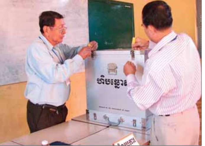
សកម្មភាពចាក់សោឃ្នុំនៅលើហិបឆ្នោត នាការបោះឆ្នោតក្នុងមក

ការងារទី២ ប្រធានគណៈកម្មការការិយាល័យបោះឆ្នោត ត្រូវដឹកនាំការត្រួតពិនិត្យសម្ភារបោះឆ្នោតមួយចំនួន។ ក្នុង នោះ ដំបូងគាត់ត្រូវត្រួតពិនិត្យមើលហិបឆ្នោត តើបាន ដំឡើងហើយ ឬនៅ? ក្នុងករណីដំឡើងត្រឹមត្រូវហើយ គាត់ត្រូវលើកបង្ហាញហិបឆ្នោតទទេ រួចបិទតម្របក្នុងនៃ ហិបឆ្នោតតាមនីតិវិធី ហើយបន្ទាប់មកចាក់សោឃ្នុំនៅលើ