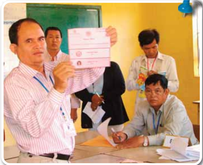
សកម្មភាពរាប់សន្លឹកឆ្នោត