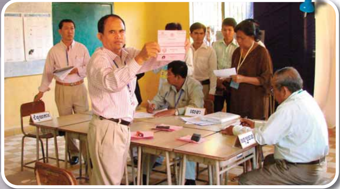
សកម្មភាពរាប់សន្លឹកឆ្នោត