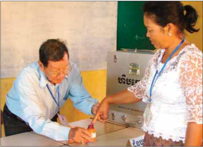
សកម្មភាពជ្រលក់ទឹកខ្មៅលុបលាងមិនជ្រះ សម្រាប់ការបោះឆ្នោតក្នុងមក

បោះឆ្នោត គាត់អាចប្រើបិបនៅក្នុងនោះ ឬក៏បិបដែល គាត់មានហើយ មិនអនុញ្ញាតឱ្យប្រើខ្មៅដៃទេ គាត់ ត្រូវតូសលើប្រអប់បួនជ្រុងនៃគណបក្សនយោបាយដែល គាត់ពេញចិត្តលើសន្លឹកឆ្នោត និងបត់តាមលំដាប់លំដោយ មកវិញ ហើយគាត់ចេញទៅកន្លែងហិបឆ្នោត នៅពេល ទៅដល់ហិបឆ្នោត គាត់ត្រូវលើកសន្លឹកឆ្នោតដែលបត់រួច នោះបង្ហាញត្រាសម្ងាត់នៅខាងខ្នងសន្លឹកឆ្នោតទៅជំនួយ ការដែលឈរនៅជិតនោះ និងអ្នកសង្កេតការណ៍ ហើយ ដាក់សន្លឹកឆ្នោតទៅក្នុងហិបឆ្នោត បន្ទាប់មកគាត់ត្រូវ ជ្រលក់ម្រាមដៃទៅក្នុងទឹកខ្មៅលុបលាងមិនជ្រះ តាមការ ណែនាំរបស់ជំនួយការ ហើយចុងក្រោយបំផុត គាត់ អញ្ជើញចេញពីការិយាល័យបោះឆ្នោតទៅតាមច្រកចេញ ដែលបានកំណត់ទុកជាមុន។