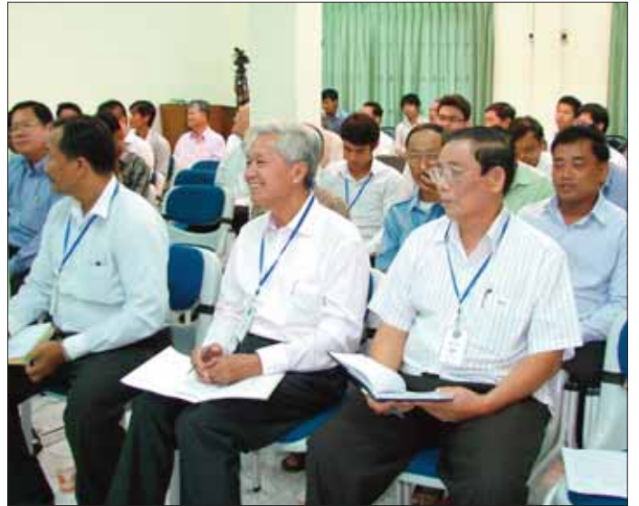
សន្និសីទសារព័ត៌មានផ្សព្វផ្សាយអំពីព្រឹត្តិការណ៍ទូទៅ និងលទ្ធផលបឋមនៃការបោះឆ្នោតឡើងវិញជ្រើសរើសក្រុមប្រឹក្សាខណ្ឌពោធិ៍សែនជ័យ

រថយន្តធំចំនួន០៩គ្រឿង រថយន្តតូច២០គ្រឿង និងអ្នកចូលរួមប្រមាណប្រហែលជាង៣៥០នាក់។ -ថ្ងៃទី០៩ ខែធ្នូ ឆ្នាំ២០១១ តាមប្រតិទិនរបស់ គណបក្សប្រជាជនកម្ពុជា មានការរៀបចំជារួប ភាពធំ ហែក្បួនចែកជា២ ក្បួនទី១ហែឆ្នងកាត់ ទឹកដី០៤សង្កាត់ គឺសង្កាត់ចោមចៅ ភ្លើងឆេះរទេះ បឹងធំ និងសង្កាត់កន្ទោក និងក្បួនទី២ហែកាត់០៩ សង្កាត់ គឺសង្កាត់កាកាប ក្រាំងធ្នង់ គោករកា សំរោងក្រោម ត្រពាំងក្រសាំង ស្មោរ ឪឡោក ពន្លាំង និងសង្កាត់កំបូល។