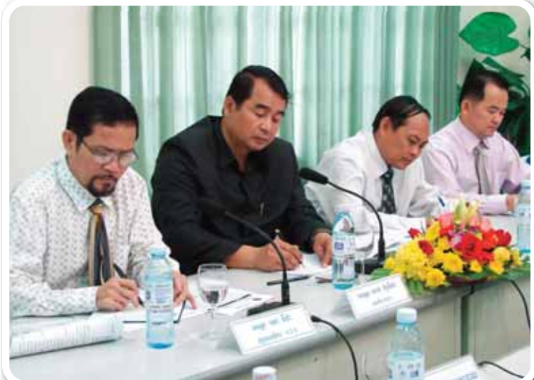
កិច្ចប្រជុំកាលបរិច្ឆេទទី២៤ ខែតុលា ឆ្នាំ២០១១