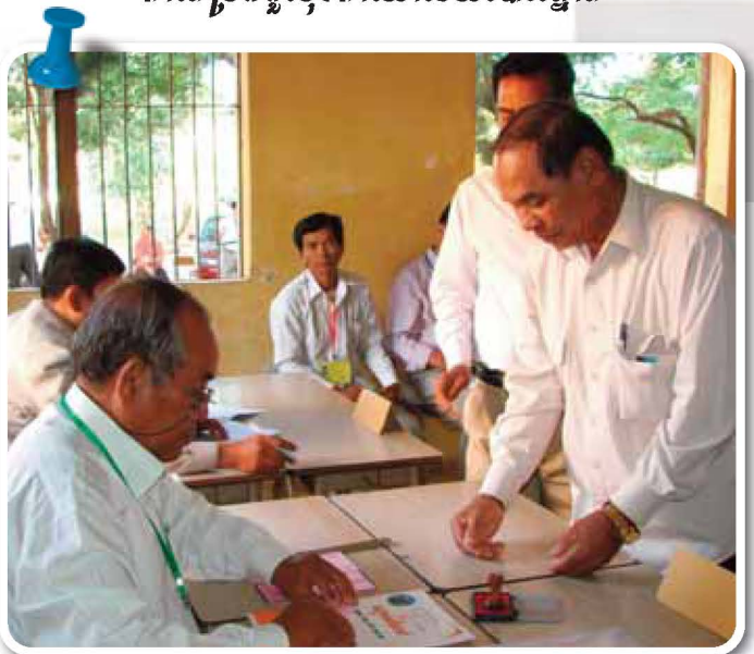
ការចូលសន្លឹកឆ្នោតរបស់អ្នកបោះឆ្នោត