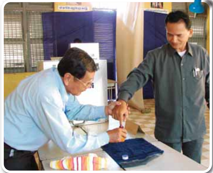
ការជ្រលក់ទឹកខ្មៅលុបលាងមិនជ្រុះ