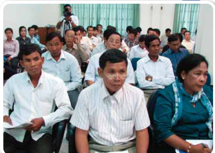
សន្និសីទសារព័ត៌មានកាលបរិច្ឆេទទី០៤ ខែវិច្ឆិកា ឆ្នាំ២០១១